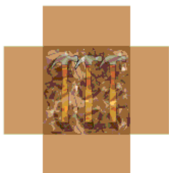
Đóng gói đối với các vật còn lại